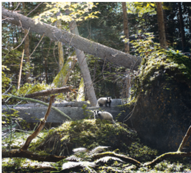
Borsuki w borze mieszanym

Płaski dotychczas teren nieco się wypiętrza i wygląd lasu się zmienia – wokół szumi bór mieszany wyrosły na glebach skrytobielicowych. W wielkiej zgodzie rosną tu pospołu grupy wiekowych sosen i świerków, dęby, osiki, brzozy i graby. Pod ich koronami chronią się leszczyny i młodzież cienioznośnych drzew. W runie, obok roślin grądowych, zieleni się perlówka zwisła, turzycza palczasta, zawilec gajowy, gwiazdnica wielkokwiatowa, borówka brusznica i czernica, gruszyczki, siódmaczek leśny, paproć orlica, jastrzębce, nawłóć zwyczajna, konwalia majowa, a tuż przy ziemi ciemniej zwały się płaty mchów.