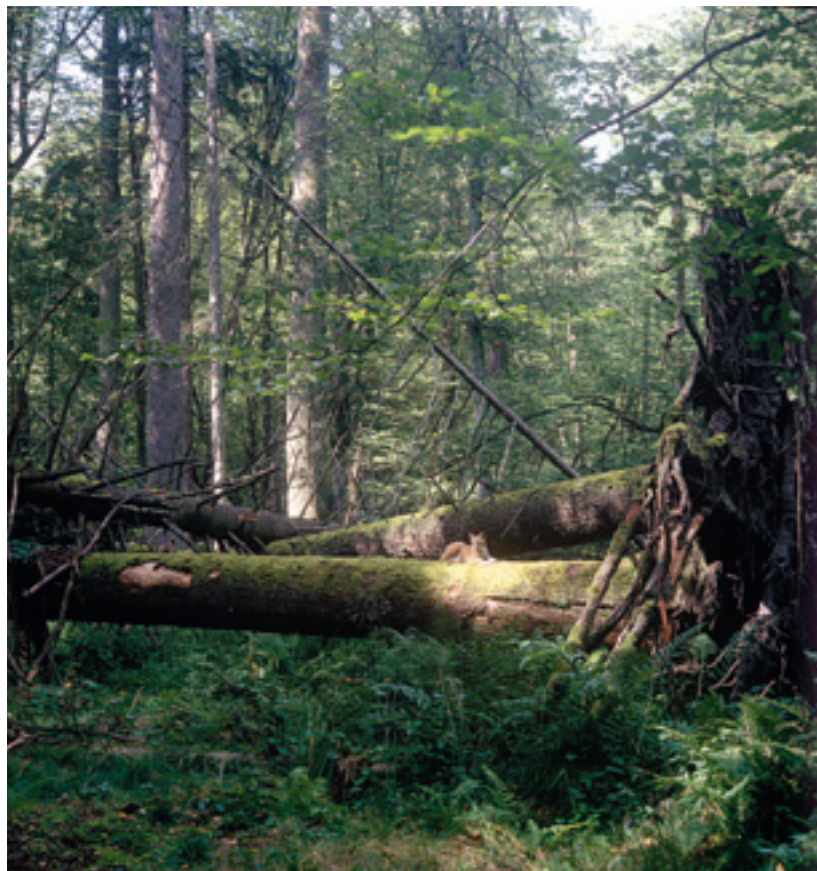
Ryś w puszczańskim mateczniku

Pięć tysięcy lat minęło od czasu, gdy lądolód wycofał się w swe pierwotne leże – szczyty gór na północy. Uchodząc przed promieniami słońca, stopniał na całej powierzchni, bluzgał i spływał strugami, przesiąkał ziemię. W odwrocie napelniał wodami wielką kotlinę u stóp Skandynawii tak długo, aż stworzył słodkie morze, szerokim ujściem wlewające się do oceanu. Na uwolnionej ziemi wszechwładnie zapanowała woda. Tworząc szeroko rozlane rzeki, pracowicie rzeźbiła dziewiczą ziemię, jeziorami wypełniała niecki i zagłębienia, tworzyła mokrzyska i bagna. Na bezkresnych równinach Europy Wschodniej, niby wyspy na oceanie, ciemniały wyniosłości dające ostatnie schronienie zwierzętom i ludziom w ich ucieczce przed potopem.