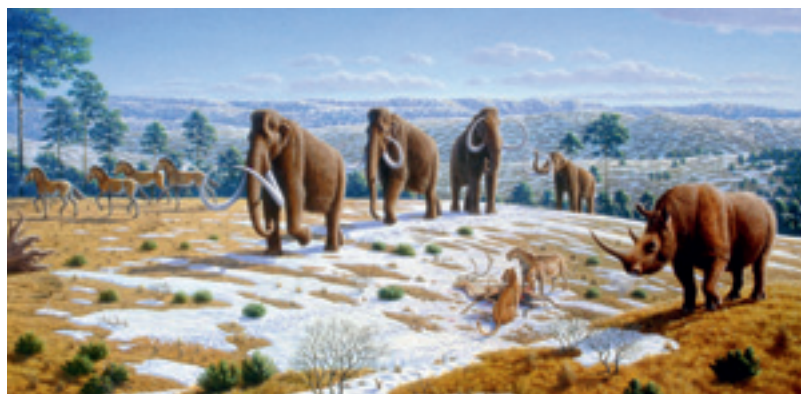
Fauna epoki lodowcowej

Ostatni milion lat historii Ziemi, zwany czwartorzędem, dzieli się na plejstocen i holocen. W plejstocenie lądolód czterokrotnie atakował Europę. W przerwach między zlodowaceniami na terenach dzisiejszej Puszczy Białowieskiej panował klimat umiarkowanie ciepły. Największe zlodowacenie (tak zwany Mindel) objęło cztery i pół miliona kilometrów kwadratowych Europy. W Polsce płaszcz lodu oparł się o Sudety i Karpaty, gdzie spotkał lodowce schodzące z gór. Na terenie przez niego objętym wyginęły wszystkie rośliny i zwierzęta.