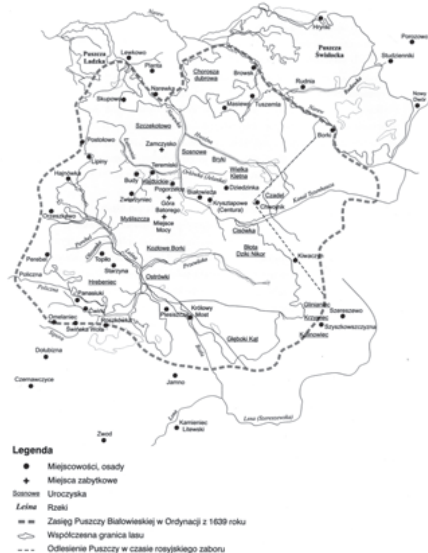
Lokalizacja miejsc wymienionych w opowieści

Nadeszła wiosna. Zimniejsza niż wszystkie ubiegłe, choć i tamte od dawna już nie dawały ciepła podtrzymującego życie drzew. Lodowate podmychy smagały umierający las. Tu i ówdzie sterczały kikuty rozłożystych dębów i lip, leżały obalone sosny, ale w poszyciu brak było młodego pokolenia. Tylko w wierzbach, brzozach i świerkach tliło się jeszcze życie. Stopniowe, od tysięcy lat postępujące oziębienie klimatu nabrało pędu. Coraz szybciej i szybciej nowe połacie Europy znikają pod lodem – tym nadchodzącym z północy i tym sunącym jezorami z gór południowych.