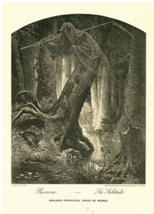
Puszcza, A. Grottgger

Puszcza Białowieska umiera. Wśród drzew przemyka okryta mgłą postać dzierżąca kosę, lecz u jej stóp nie czai się już ryś skośnooki, nie wyciągają ramion pokrzywione kolosy lip i wiekowe dęby.